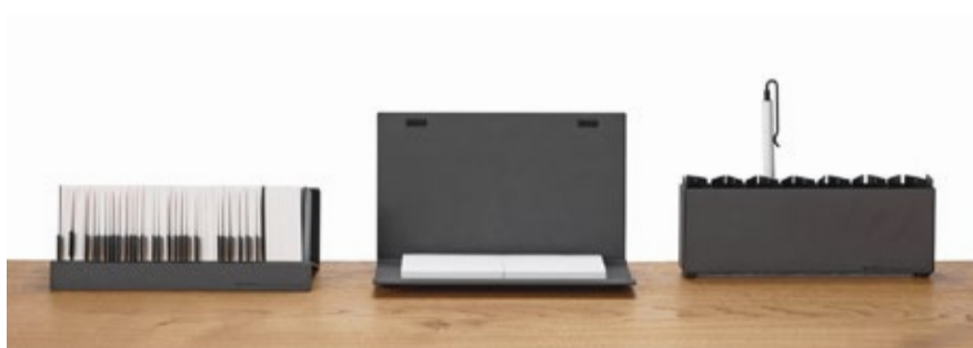
名刺ストックカー Card Stocker