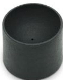
シリンダー / Cylinder