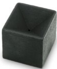
スクエア / Square